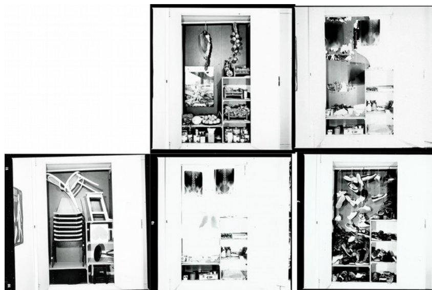
[Ilustração 2: Eu armário de mim (Parente, 1975) Fotograma de frames.]

inscreve subjetividades e potências críticas. O poema em Eu armário de mim (1975) transita entre os registros fotográficos e os acúmulos das trajetórias de vida ali representadas através dos objetos. Nesses trabalhos o texto não é submisso a imagem, mas caminha com ela.